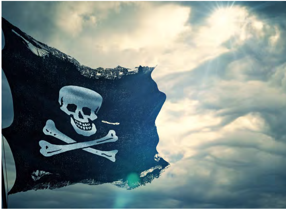
Hacker versuchen immer wieder, Unternehmen zu kapern und Beute zu machen. Immer öfter klappt es.

Ransomware auf Rekordjagd / Treasury-Chefs verunsichert und besorgt