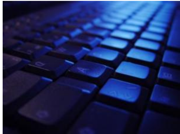
Die Angst vor Hackerangriffen ist groß

Düsseldorf (pte/30.03.2009/06:00) - Laut einer Studie halten in Deutschland mehr als die Hälfte aller mittelständischen Unternehmen Spionage und Informationsdiebstahl oder -verlust für die größten Risiken, denen sie ausgesetzt sind. Genau die Hälfte der Befragten hat außerdem angegeben, sich vor Hackerangriffen zu fürchten. Daher wollen auch fast 30 Prozent in den nächsten zwei Jahren in IT-Sicherheit investieren. Korruption sehen hingegen nur 29 Prozent als ein reales Risiko. Die Studie des Sicherheitsunternehmens Corporate Trust hat zusammen mit dem Handelsblatt erhoben, wie es um das Gefahrenbewusstsein der deutschen Unternehmen bestellt ist. Befragt wurden dafür Geschäftsführer, Vorstände, Sicherheitsverantwortliche sowie IT- und Personalleiter in mittelständischen Unternehmen aller Branchen.